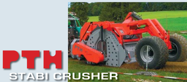
PTH STABI CRUSHER

Aportamos la experiencia y conocimientos adquiridos durante más de 20 años construyendo máquinas y carreteras.